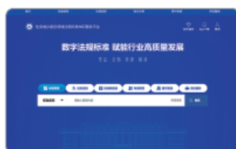
① 住建领域法规标准，随心查，放心用