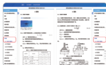
④ 历史版本对比，同步翻阅，精准了解法规标准制修订情况