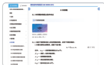
③ 法规标准条文内嵌专家解读音视频，帮助用户深刻理解条文本质