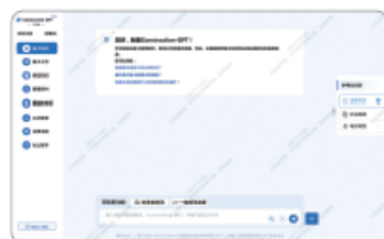
⑥ 施工知识AI，覆盖地基与基础工程、钢结构施工等多个领域