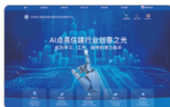
⑤ 法规标准AI，支持智能问答、智能集成和智能翻译等多项功能